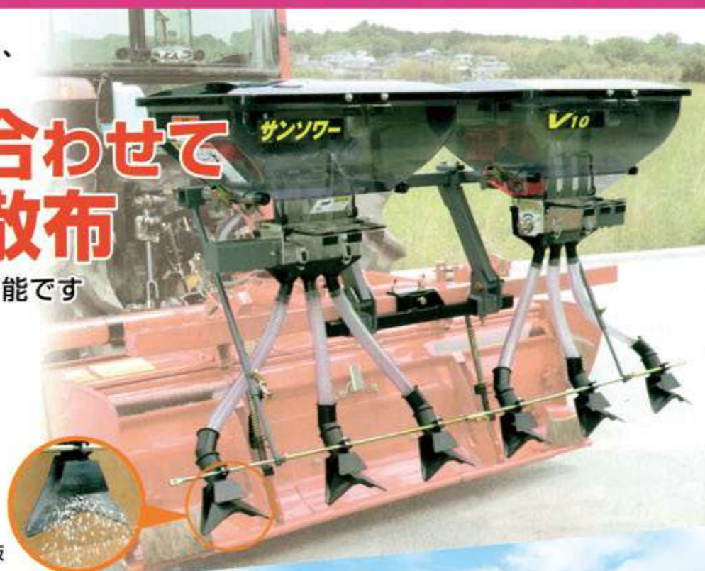
樹脂製 ワイド拡散板